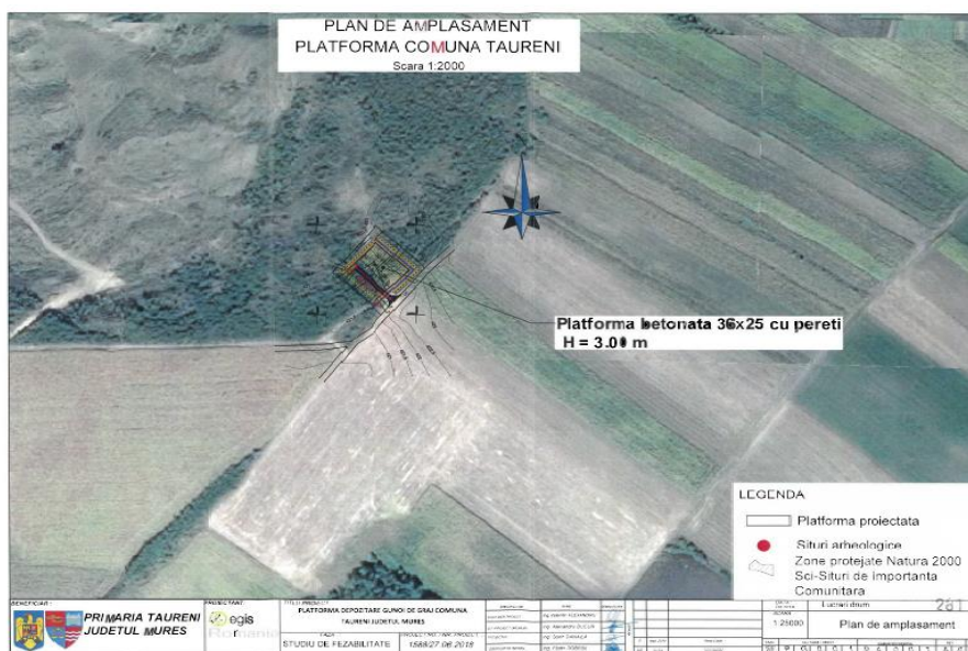
Plan de amplasament

Planuri de situație, planuri generale, profile longitudinale și transversale, cu situatia proiectată, sunt prezentate mai jos: